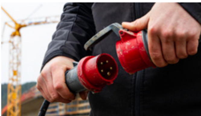
Die ergonomisch durchdachten Linien bieten perfekten Halt in jeder Situation.

Ohne Werkzeug installieren, dank QUICK-CONNECT Anschlusstechnik. So einfach geht's: Gehäuse aufschrauben. Anschlussleitung durch offene MULTI-GRIP Verschraubung einführen. Abisolierten Leiter in offene Klemmen stecken und per Klick verschliessen. Gehäuseteile und MULTI-GRIP Verschraubung fest zudrehen.