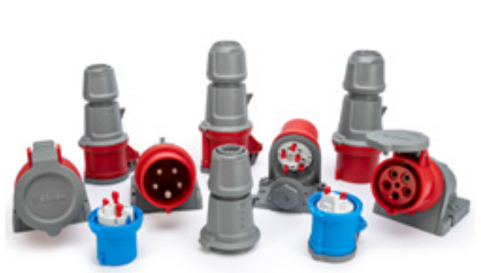
Die neuen INNOLINQ-Steckvorrichtungen sind von 16A bis 32A verfügbar.